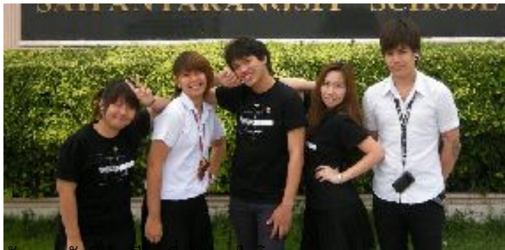
ตัวแทนนักศึกษาป 1 ทหารวมในโครงการ มอบโปสเตอร์สู่โรงเรียนมัธยม