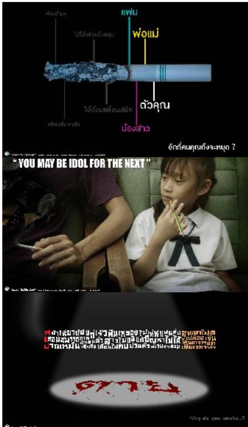
ต้นแบบที่ 1