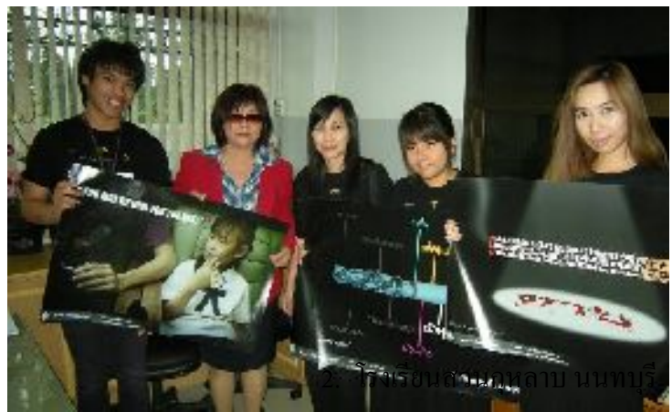
2. โรงเรียนสวนกุหลาบ นนทบุรี