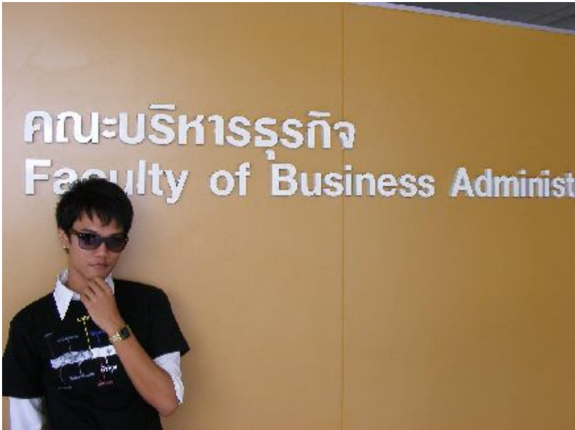
ภาพบรรยากาศในส่วนที่ 1 : โพสต์เตอร์เพื่อใช้ในการติดประชาสัมพันธ์ทุกอาคารเรียน ตัวแทนนักศึกษาประสานงานโครงการ สวมเสื้อ โครงการช่วงการณรงค์ ต้นปีการศึกษา 1/ 2553