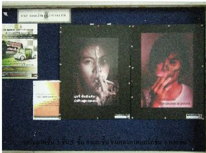
เสริมภาพชั้น 1 ชั้น 5 ชั้น 8 และชั้น 9 แสดงภาพบอร์ดชั้น 1 และชั้น 5