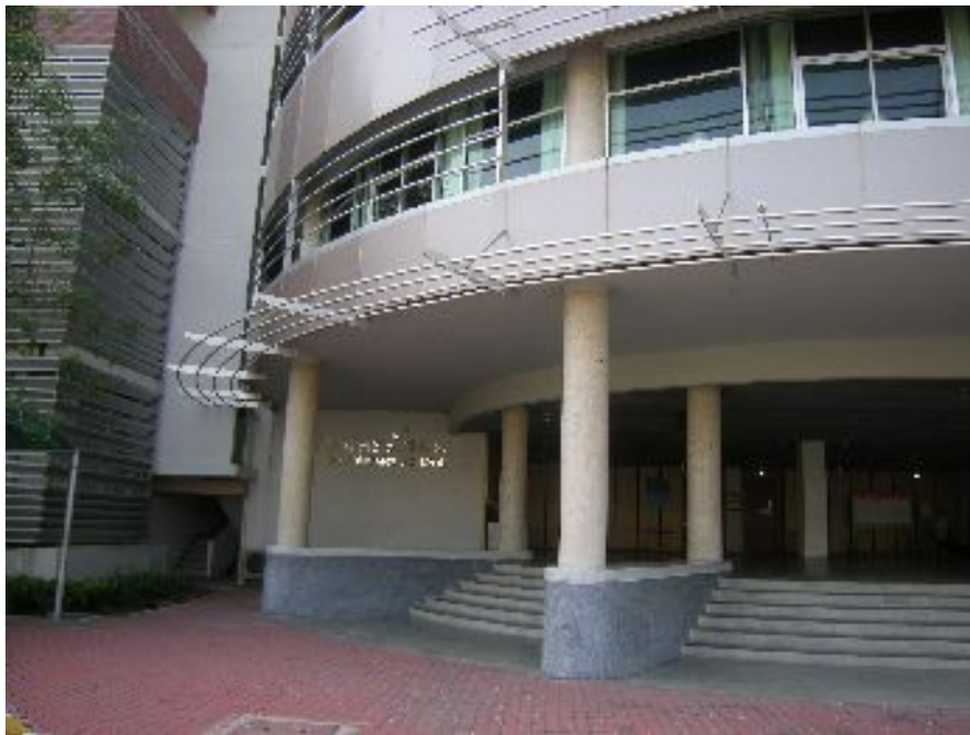
โพลีเตอร์ติดภายในตึกมัธยม โรงเรียนสาธิต แห่งมหาวิทยาลัยรังสิต