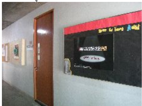
หน้าห้องปฏิบัติการศิลปะ