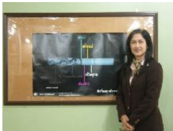
หน้าห้องธุรการและห้องเรียนชั้น 2 กับอาจารย์ผู้ประสานงาน