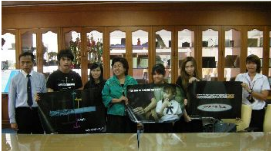
1. โรงเรียนสายปัญญา