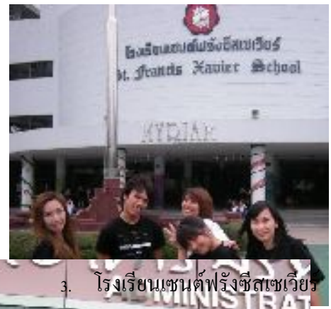
3. โรงเรียนเซนต์ฟรังซิสเซเวียร์