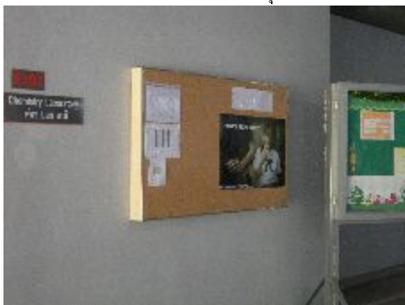
หน้าห้อง Lab เคมี